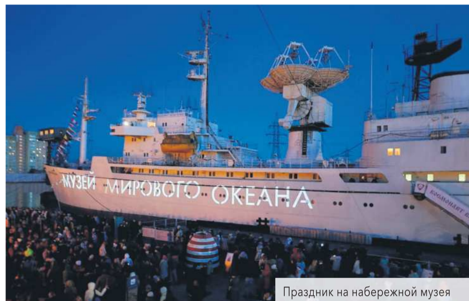
Праздник на набережной музея

Надзорные органы озаботились безопасностью стоянки судна. Пришлось провести испытания. На другой берег Преголи поставили два гружёных «КрАЗа», подключили динамометр и давали на тросы в кольцах нагрузку. Одно кольцо с уверенностью держало 18 тонн, а вот чтобы привести судно в движение, необходимо лишь 5 (такое возможно при ветре в 50 м/с, но это крайне редкое погодное явление). Дополнительно уста-