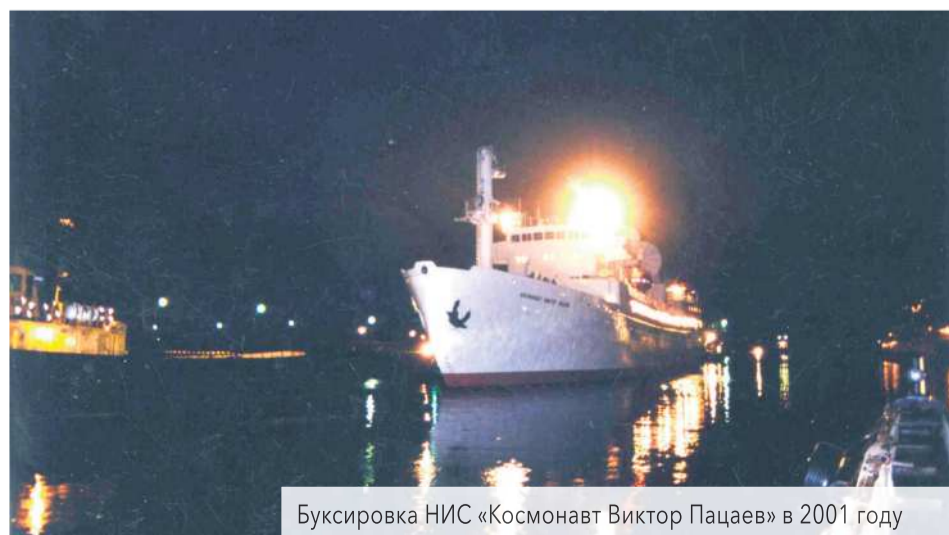
Буксировка НИС «Космонавт Виктор Пацаев» в 2001 году