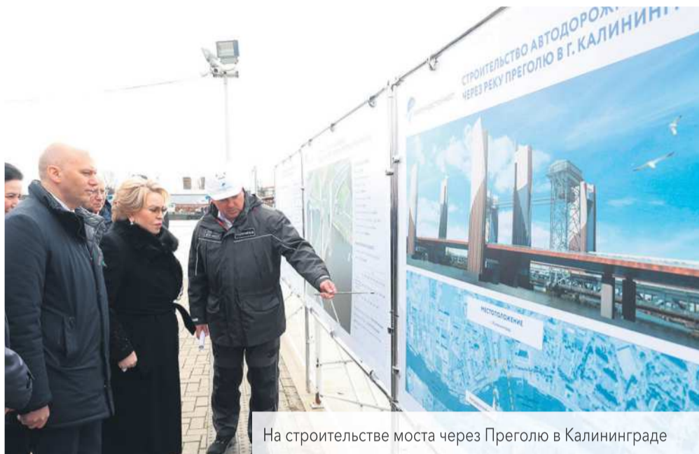
На строительстве моста через Преголю в Калининграде