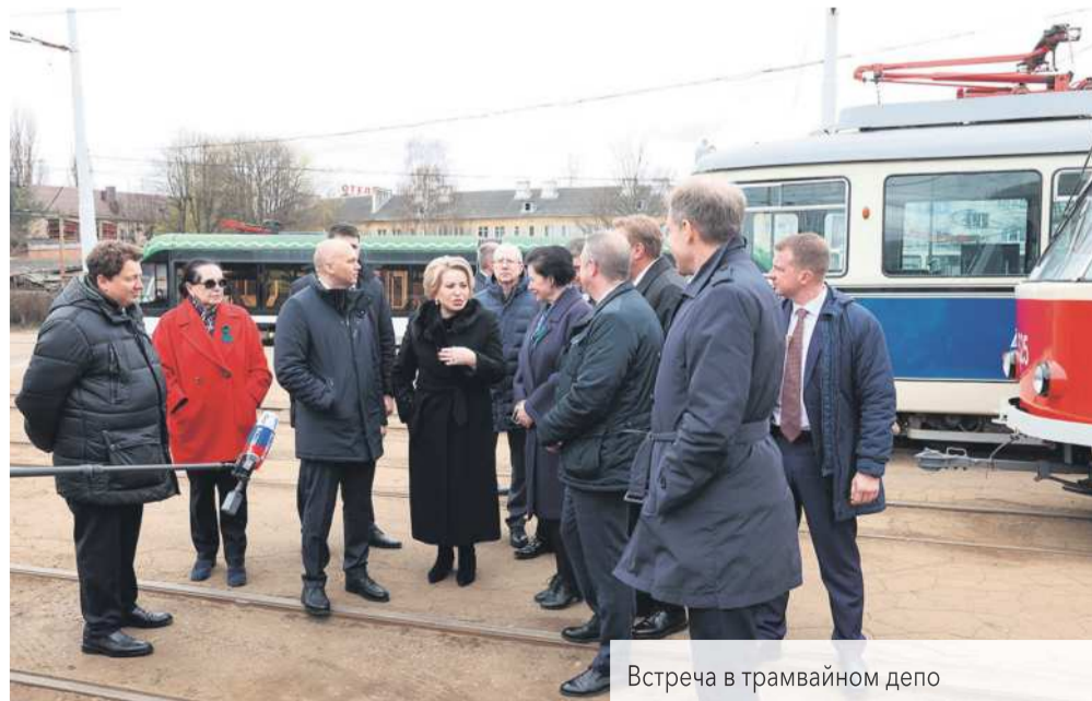
Встреча в трамвайном депо