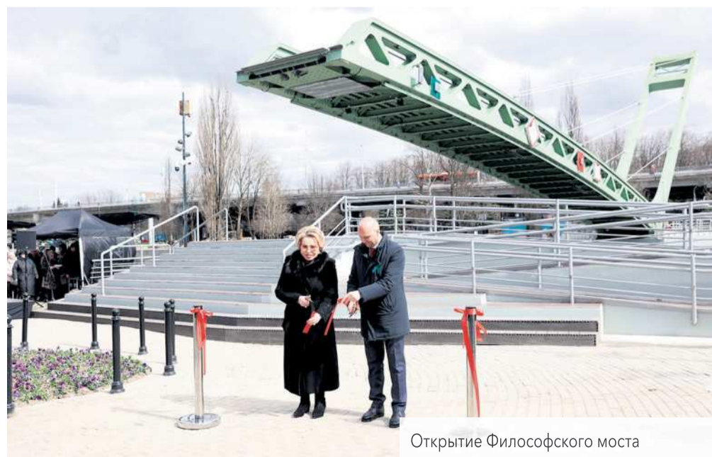
Открытие Философского моста