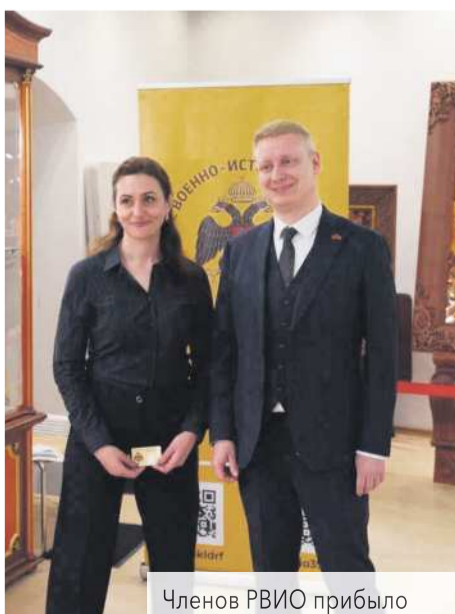
Членов РВИО прибыло