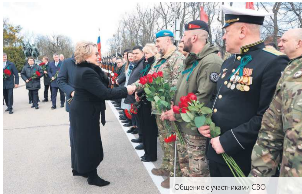
Общение с участниками СВО

Губернатор отметил, что благоустройство острова Канта продолжится, будут заменены коммуникации, установлены новая система освещения и малые