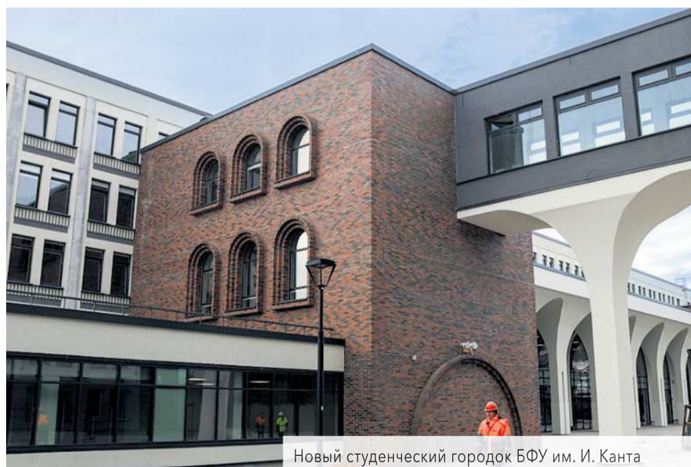
Новый студенческий городок БФУ им. И. Канта