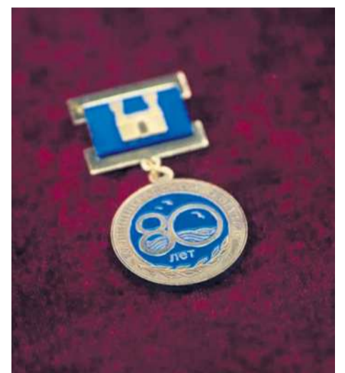
Медаль в честь 80-летия региона