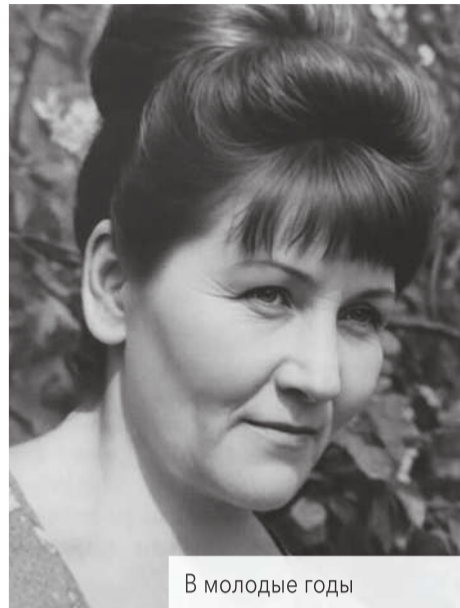
В молодые годы

Мы с сестрой дрожали от страха и боялись пошевелиться, а мать с братом всю ночь просидели на кровати.