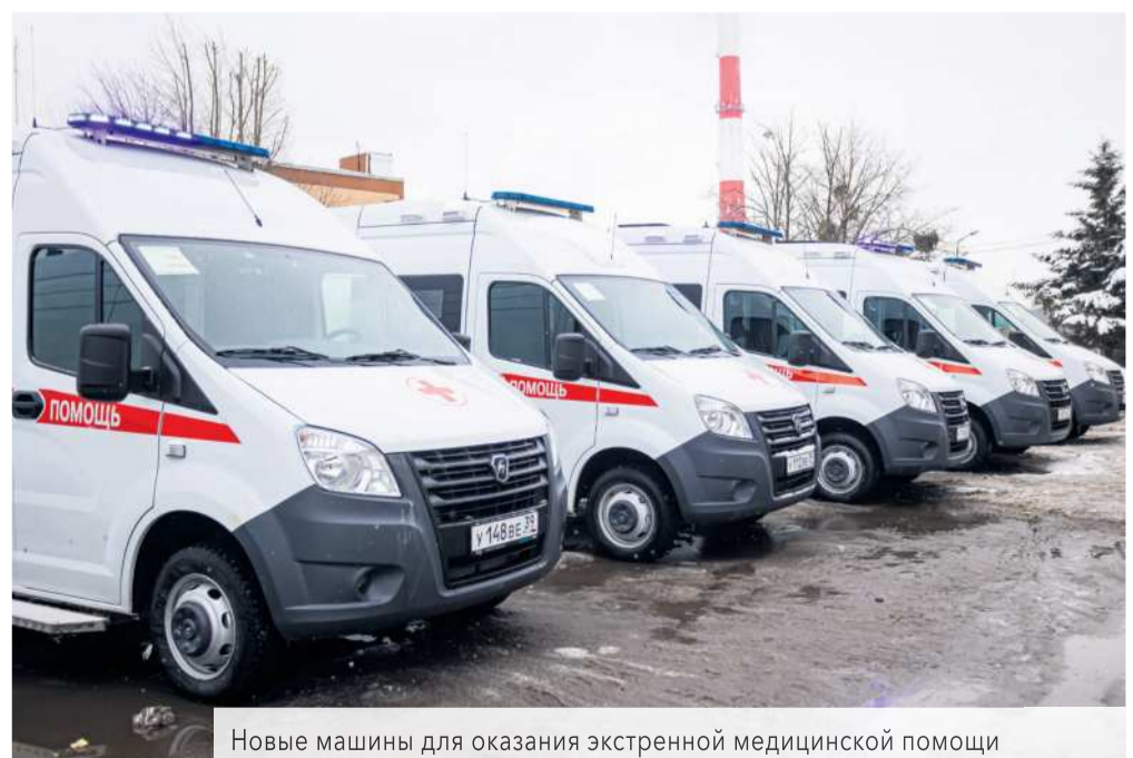
Новые машины для оказания экстренной медицинской помощи