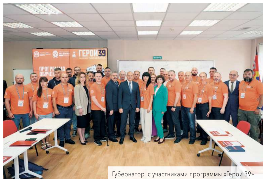
Губернатор с участниками программы «Герои 39»