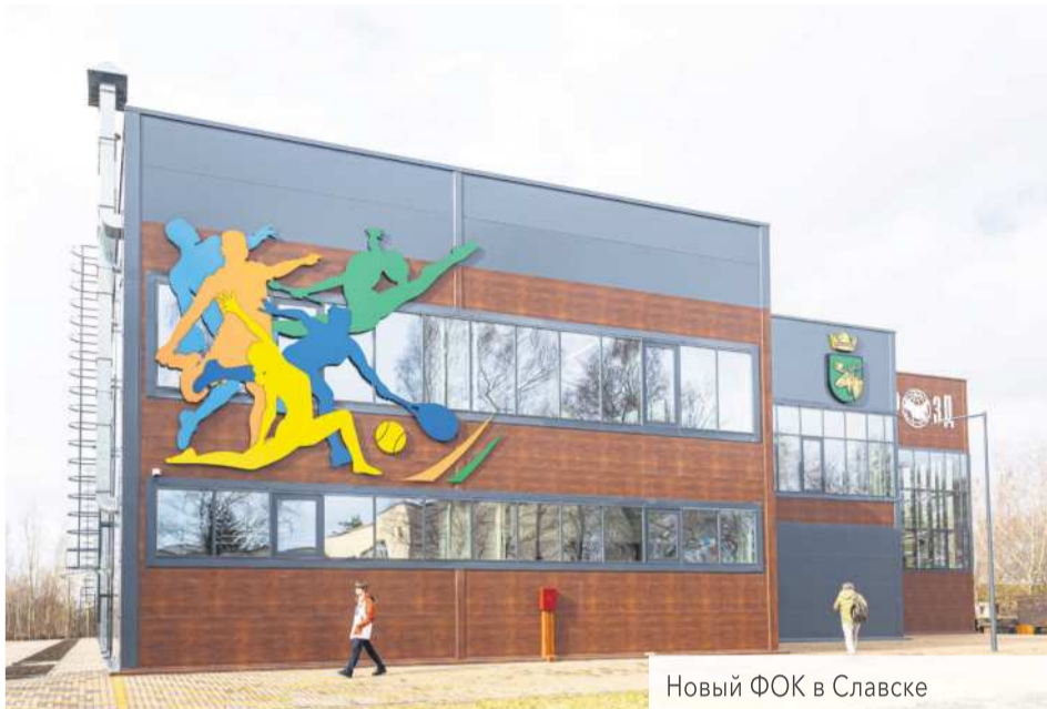
Новый ФОК в Славске