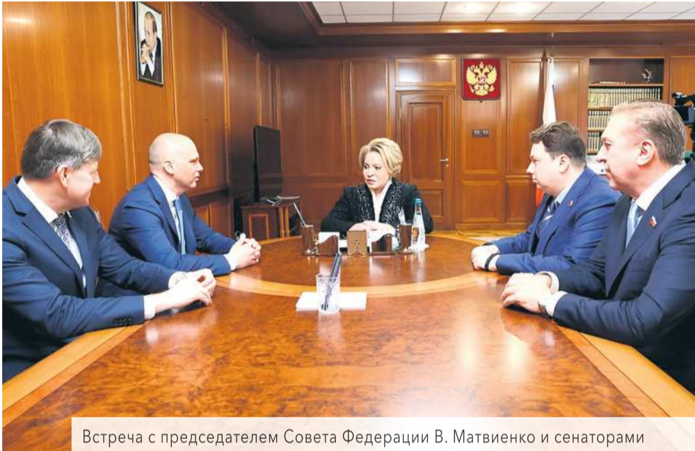
Встреча с председателем Совета Федерации В. Матвиенко и сенаторами

В Москве прошли Дни Калининградской области, на которых поднимались важные для региона темы – от развития коммунальной инфраструктуры, образования, науки до транспортной доступности и льготных лекарств. Расскажем, как главе региона в Совете Федерации удалось доказать уникальность янтарного края и какую поддержку мы получим