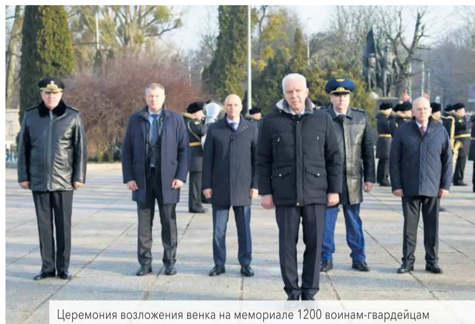
Церемония возложения венка на мемориале 1200 воинам-гвардейцам

интересов граждан, состояние законности в ходе расследования уголовных дел или в ходе поддержания государственного обвинения».