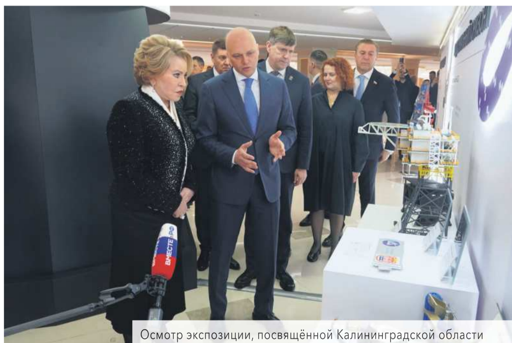
Осмотр экспозиции, посвящённой Калининградской области