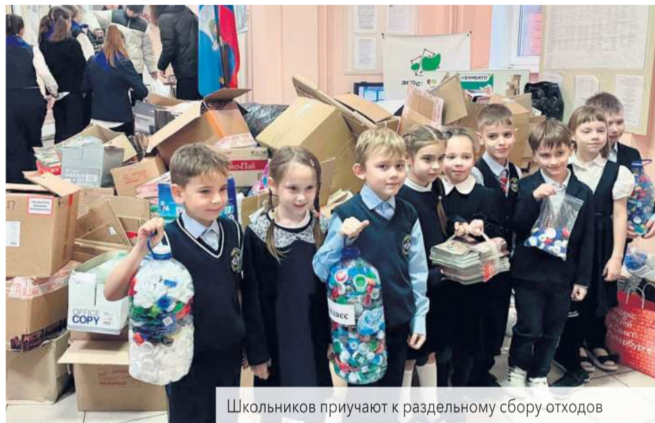
Школьников приучают к разделному сбору отходов

Впервые за последние 5 лет министерства природы начали применять институт общественных инспекторов по охране